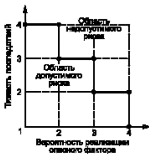
Рисунок Б.1 — Диаграмма анализа рисков

Если точка лежит на или выше границы — фактор учитывают, если ниже — не учитывают.